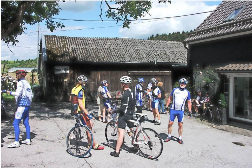
Rast bei der RTF Nachttour an der Kontrollstelle Schmiede.