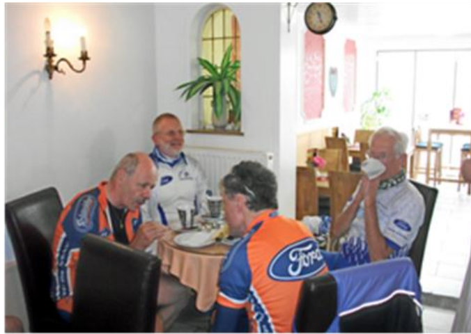
Verpflegung unterwegs und im Cafe Fahlenbock