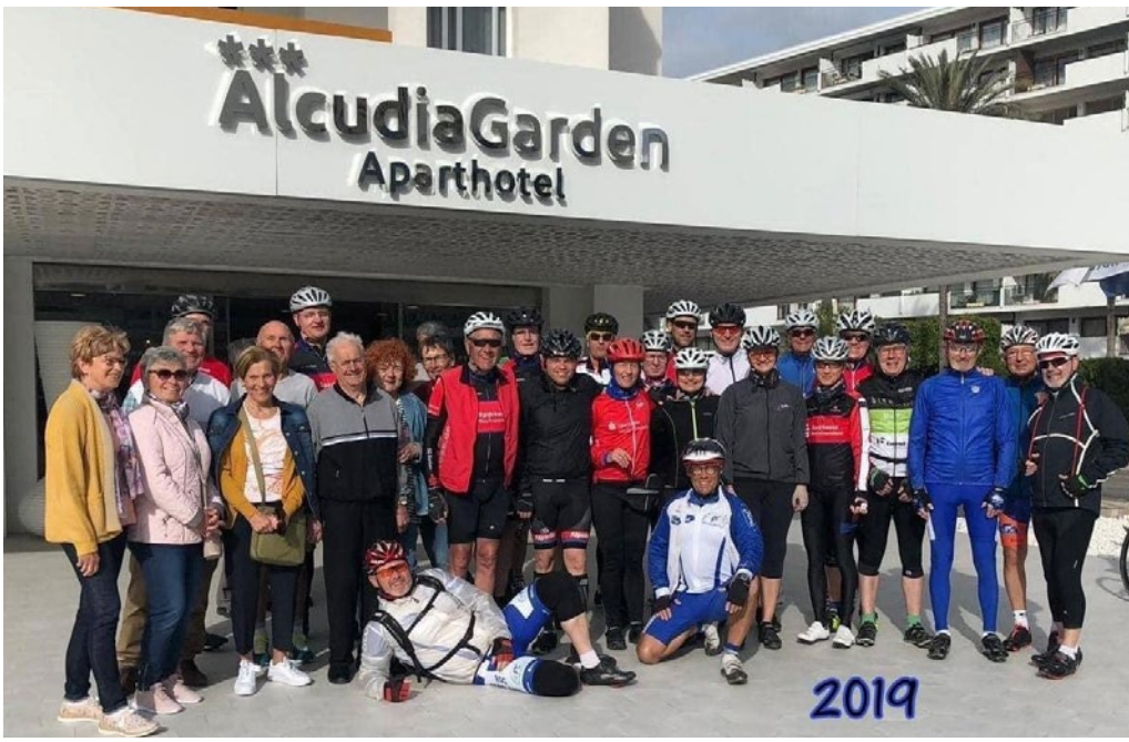
Alcudia Garden Aparthotel