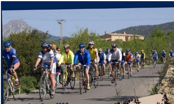
Santa Ponca 2009