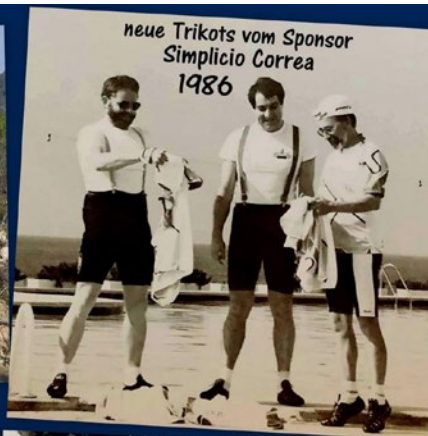
neue Trikots vom Sponsor Simplicio Correa 1986