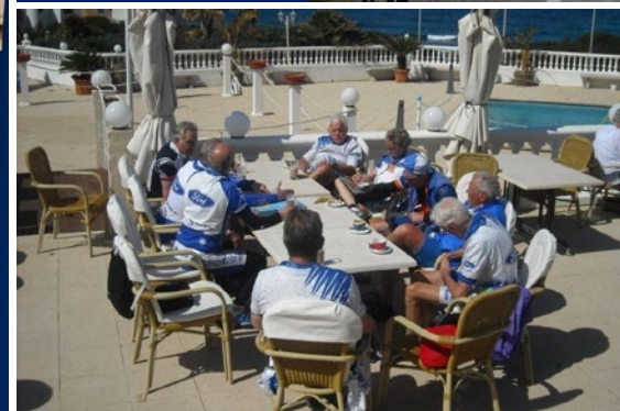
Abschlussfahrt immer zum Casa Blanca in Betlem